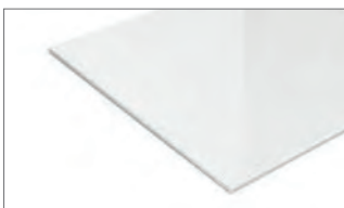
alternative Glasfarbe weiß